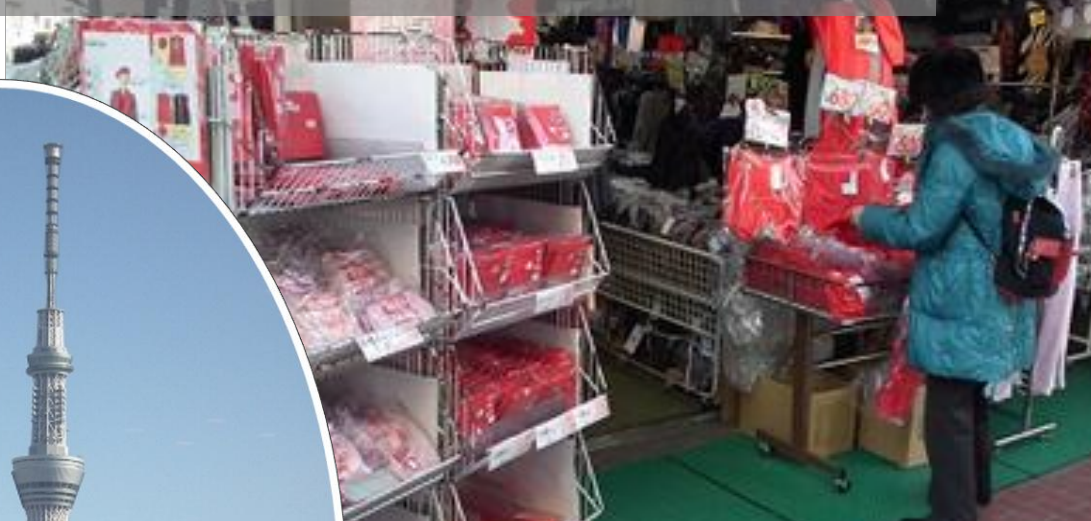
築鴨：地蔵通り商店街名物 赤パンツ