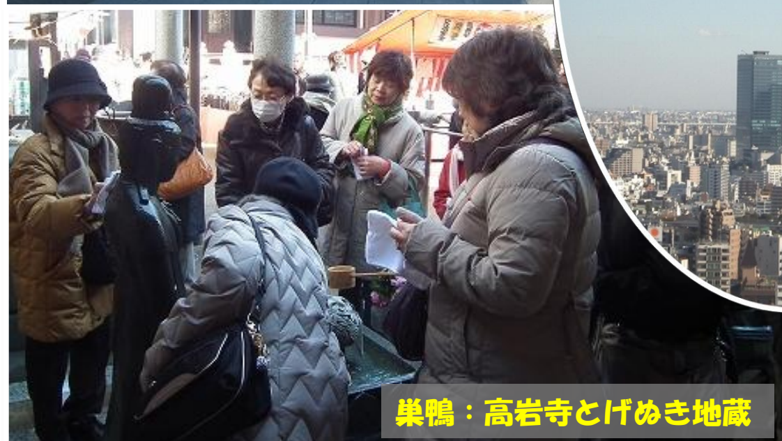
築鴨：高岩寺とげめき地藏